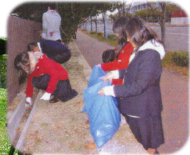
六甲アイランド高校 のクリーン作戦