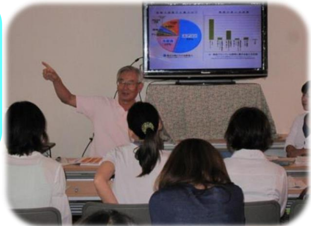
保護者向けの環境学習