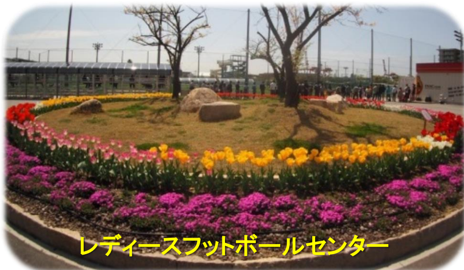
レディースフットボールセンター