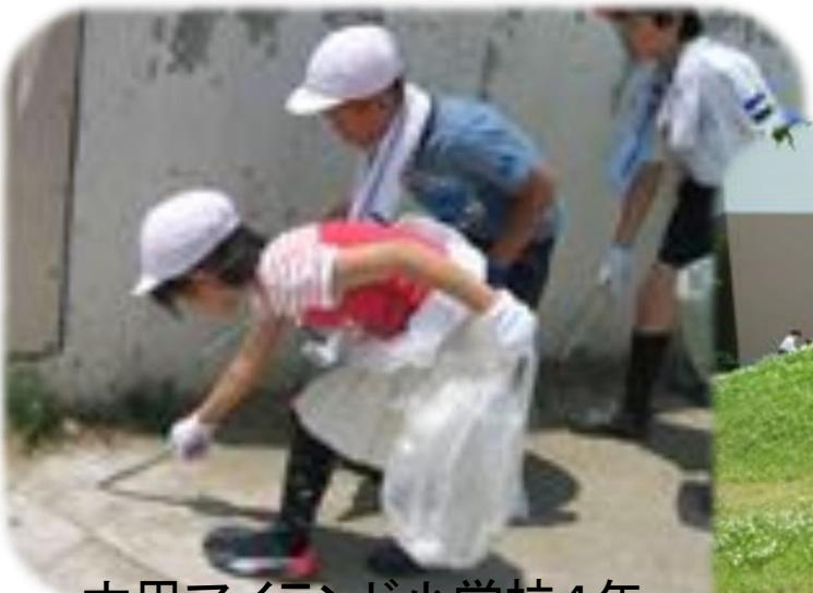
六甲アイランド小学校4年 のクリーン作戦