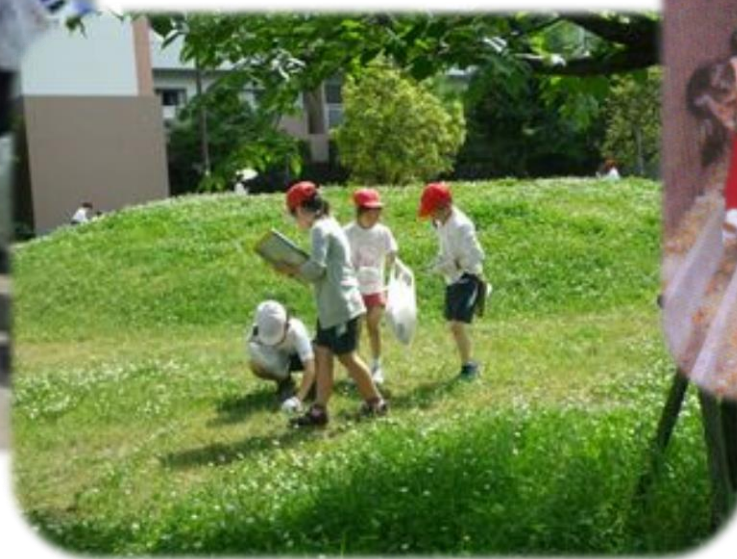
向洋小学校4年 のクリーン作戦